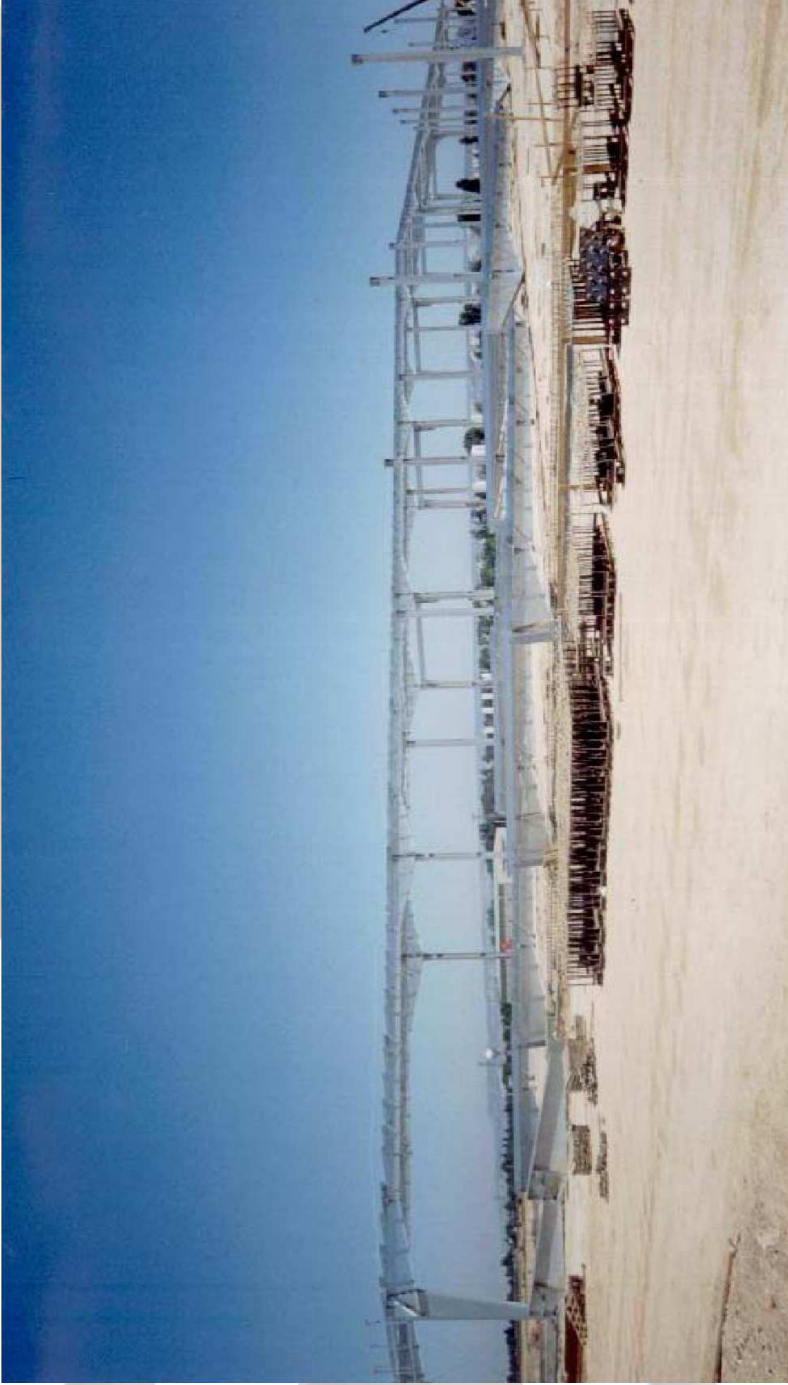
MONTAJE DE ESTRUCTURA METÁLICA NA VE DE INDITEX - ZARAGOZA (HÍASA)